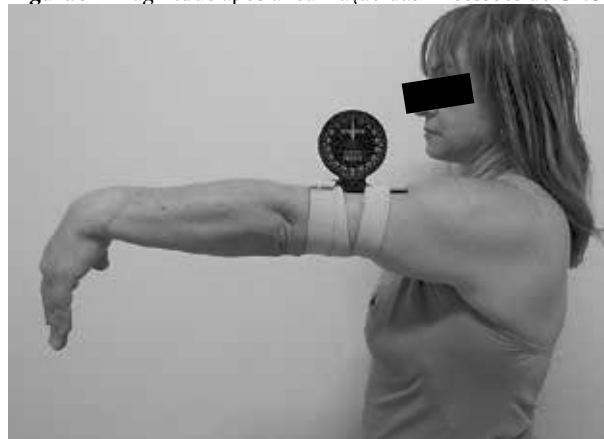
Figura 9 - Magnitude após a realização das 12 sessões de CRO.

A ilustração da magnitude dos efeitos após a realização das 12 sessões de CRO se observa na Figura 9.