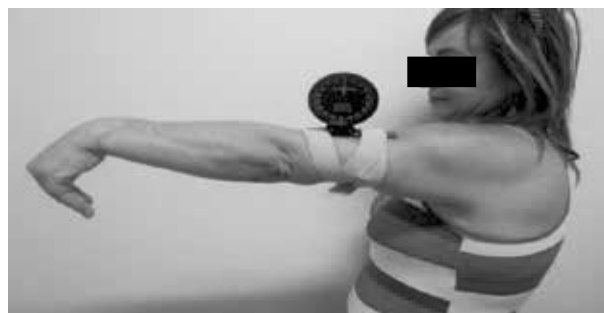
Figura 8 - Magnitude antes da realização das 12 sessões de CRO.

A ilustração da magnitude dos efeitos antes da realização das 12 sessões de CRO se observa na Figura 8.