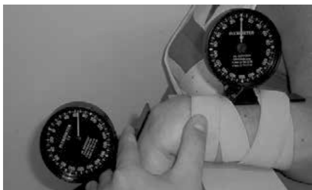
Figura 1 - Inclinômetros Plurimeter V ® e Retângulo de madeira.

Para o registro dos dados, foi utilizado um formulário, contendo nome, idade, data, medida pré-intervenção (PRÉ) e pós-intervenção (PÓS), sendo que em cada medida – (PRÉ) e (PÓS) – as aferições foram coletadas três vezes e depois, retirada a média. Foram utilizados, entre outros, os seguintes materiais: dois inclinômetros marca Plurimeter V ® (Figura 1), um retângulo de madeira (Figura 1) e um gancho de aço com duas extremidades (Figura 2). O gancho possui uma extremidade com curvatura maior e a outra com curvatura menor para que seja possível buscar uma melhor adaptação aos acidentes anatômicos sob a pele submetidos ao tratamento. O inclinômetro utilizado no presente estudo demonstrou ser válido e reprodutível em estudos publicados na literatura (BOYD, 2012; GREEN et al., 1998; SAUR et al., 1996; WATSON et al., 2005).