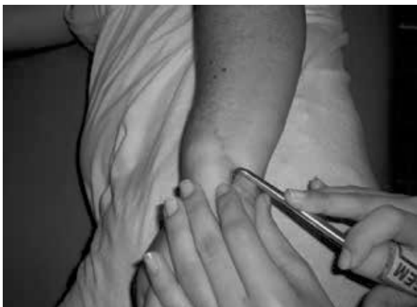
Figura 4 - Tração para tecido cicatricial

A intervenção foi realizada com três técnicas de CRO: (1) tração para tecido cicatricial, (2) tração para ventre e tendão muscular e (3) Drenagem. A tração do tecido cicatricial (Figura 4), realizada com o paciente em decúbito lateral, quadris e joelhos semiflexionados e com os pés apoiados na maca. Nessa posição, foram demarcados com lápis dermatográfico os limites anatômicos do tecido cicatricial para o posicionamento da curva menor do gancho, realizando cinco movimentos curtos em cada ponto e repetidos por cinco vezes em um eixo paralelo à cicatriz, em todo o seu trajeto longitudinal da direita para esquerda, da esquerda para a direita, de cima para baixo e de baixo para cima. Esse procedimento era realizado de modo que quatro trajetos de aplicação fossem executados de uma extremidade a outra da cicatriz.