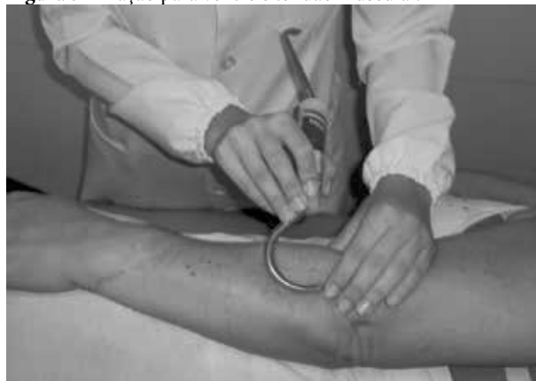
Figura 5 - Tração para ventre e tendão muscular.

dos e com os pés apoiados na maca. Nessa posição, foram marcados com lápis dermatográfico os limites anatômicos da musculatura extensora do carpo para o posicionamento da curva maior do gancho e início da aplicação. O ventre e os tendões musculares em seguida foram submetidos à tração em todas as suas extensões no sentido distal para proximal. A cada palpção instrumental, pontualmente, executaram-se cinco movimentos de tração, sendo os limites anatômicos percorridos cinco vezes.