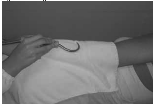
Figura 6 - Drenagem

Em seguida, foi realizada a técnica de drenagem (Figura 6), sobre uma toalha colocada sobre a musculatura extensora para facilitar o deslizamento. Essa técnica foi feita em sentido ascendente e repetida cinco vezes em cada limite (medial, central e lateral).