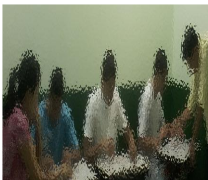
Figura 3: Alunos assistindo Vídeo.