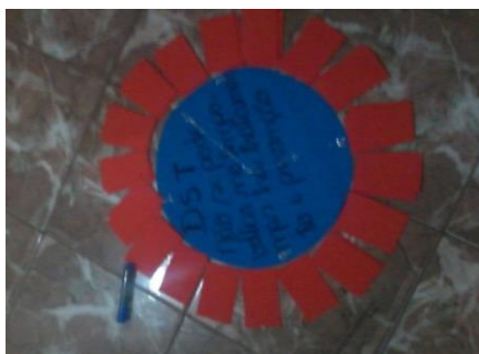
Figura 5: Imagem geral do jogo