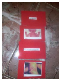
Figura 6: Cartas do jogo