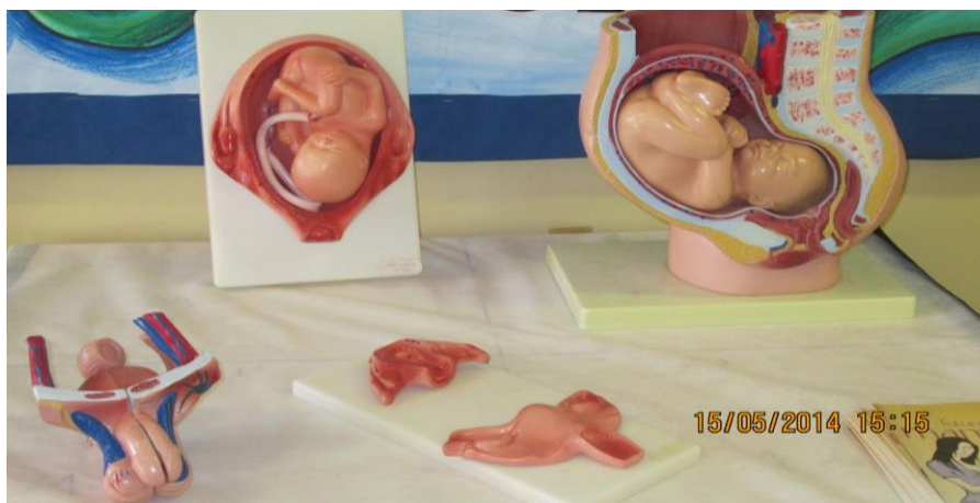
Figura 8: Modelos usados na UIV