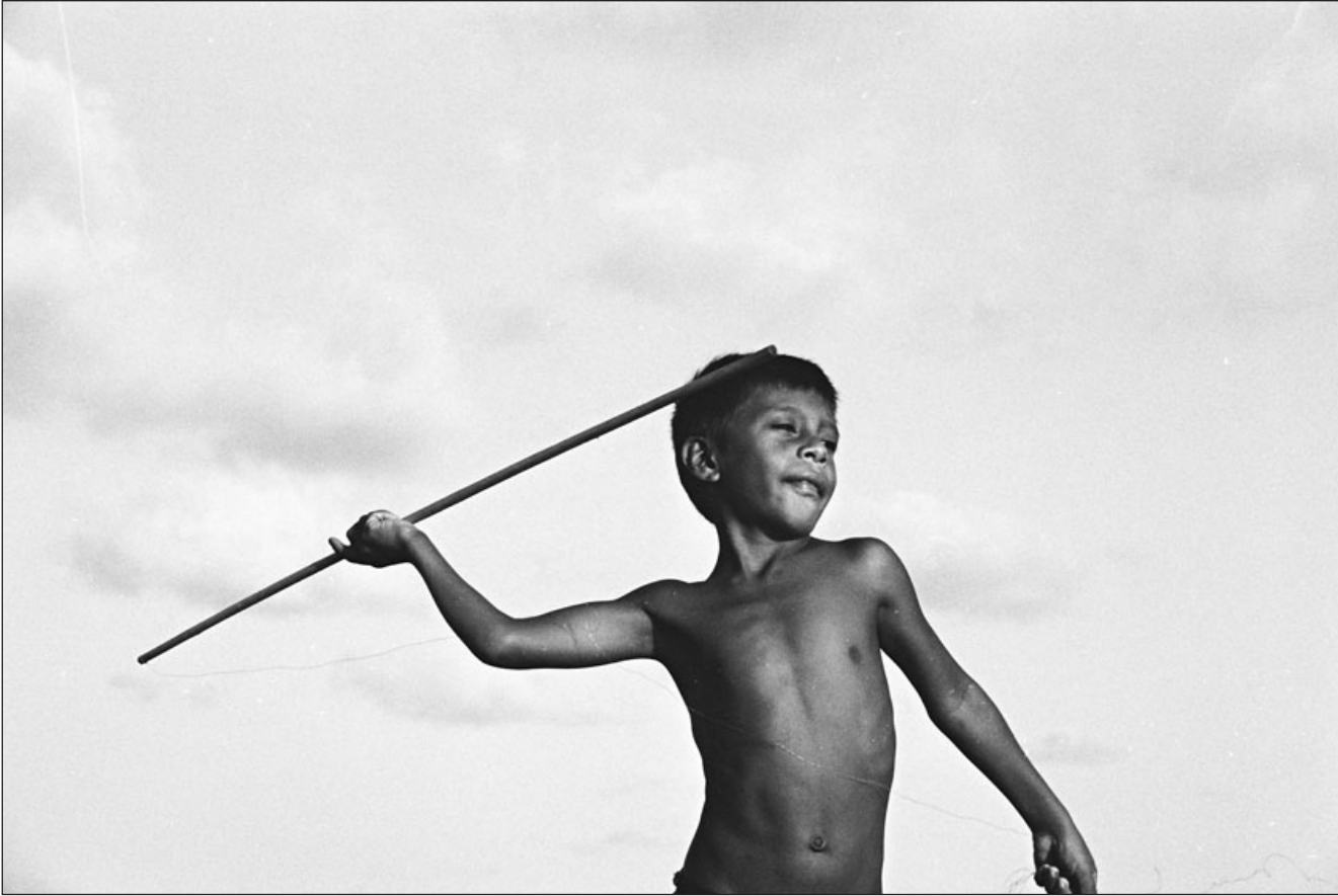
Figura 5 – A experimentação lúdica nos lagos é incentivada e tem outros pescadores como espectadores. Estes comentam jocosamente, em tom de desafio ou menosprezo, o desempenho das crianças e jovens, que reagem no mesmo tom, formando uma interação agonística acerca dos predicados viris de um arpoador. [Passarinho]