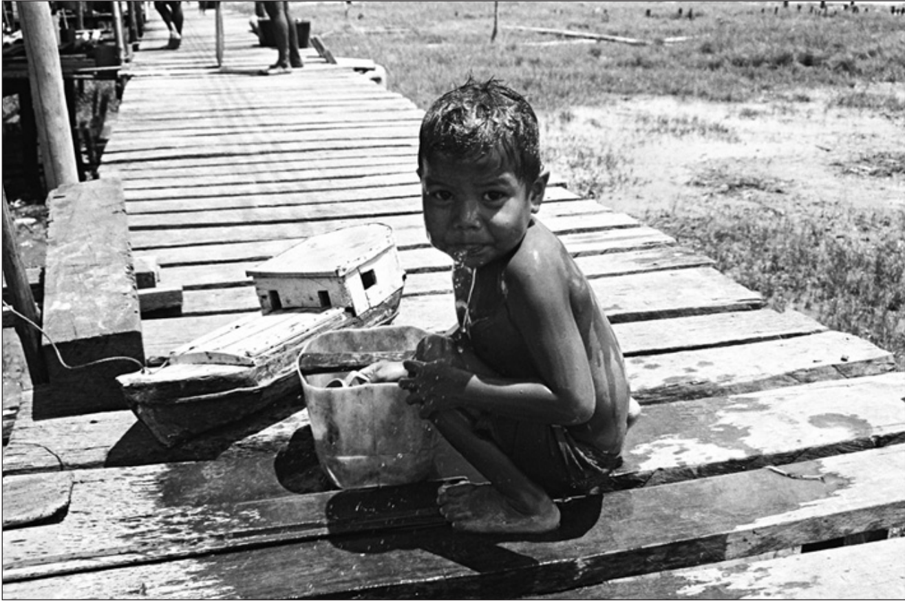
Figura 9 – Apesar de totalmente alheios à experiência embarcada, durante a infância os filhos de pescadores costeiros vivem intensamente a relação com o barco e com a água, exercitando antecipadamente o tipo de relações em que estarão envolvidos no futuro. [David]