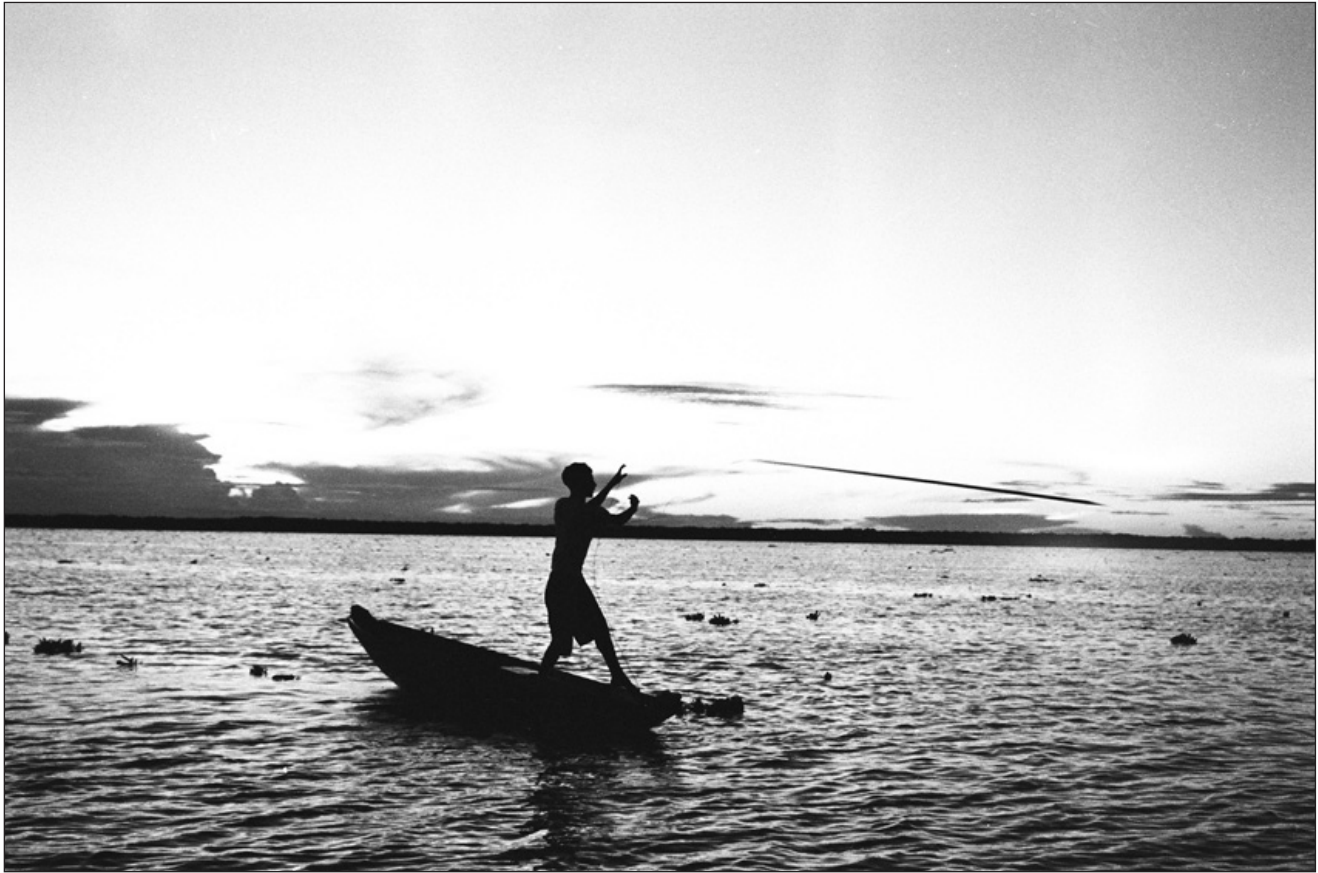
Figura 8 – Prestes a assumir sua própria canoa e arpão, os jogos lúdicos dão lugar a demonstrações mais circunspectas com o arpão, buscando apurar a destreza deste gesto altamente sofisticado e afirmar diante dos demais a sua autonomia iminente. [Alan]