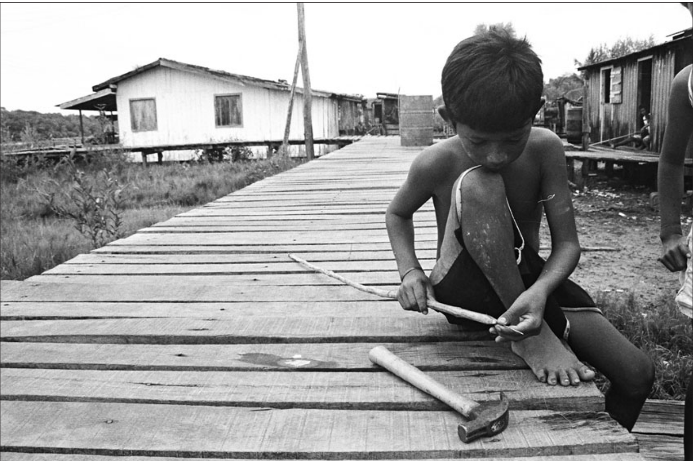
Figura 1 – As dimensões e o potencial agressivo da arma desenvolvem-se com a criança. A permissão para dotar seu arpão de uma ponta em metal é o signo decisivo de amadurecimento – do auto-controle de suas capacidades ofensivas. [Luciano]