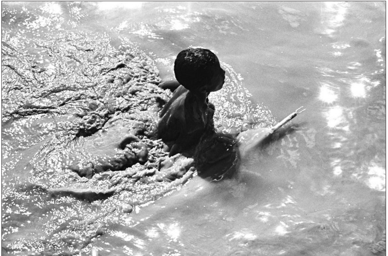
Figura 2 – Enquanto incrementam sua intimidade com o arpão, os pequenos laguistas brincam submersos, colocando-se na posição do peixe, experimentando através dessa inversão os modos de deslocamento e de percepção do animal. [Roni]