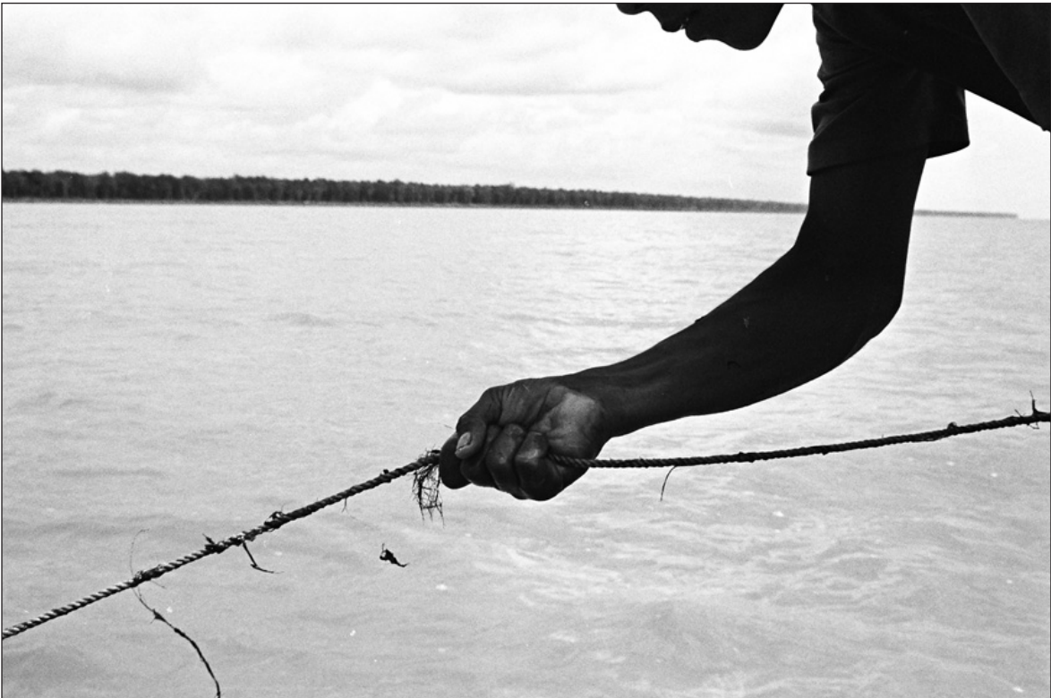
Figura 15 – Em suas primeiras viagens, o neófito vive desafio penoso e crucial, em que prova ser capaz de exercer este ofício. Espécie de rito de passagem, esse envolvimento sem mediações pedagógicas na dinâmica do trabalho é que adéqua seu corpo à vida embarcada. As mãos habituadas à casa e à escola transformam-se dolorosamente em garras, através do contato com o sal e a tensão de linhas e cordas. [Pablício]