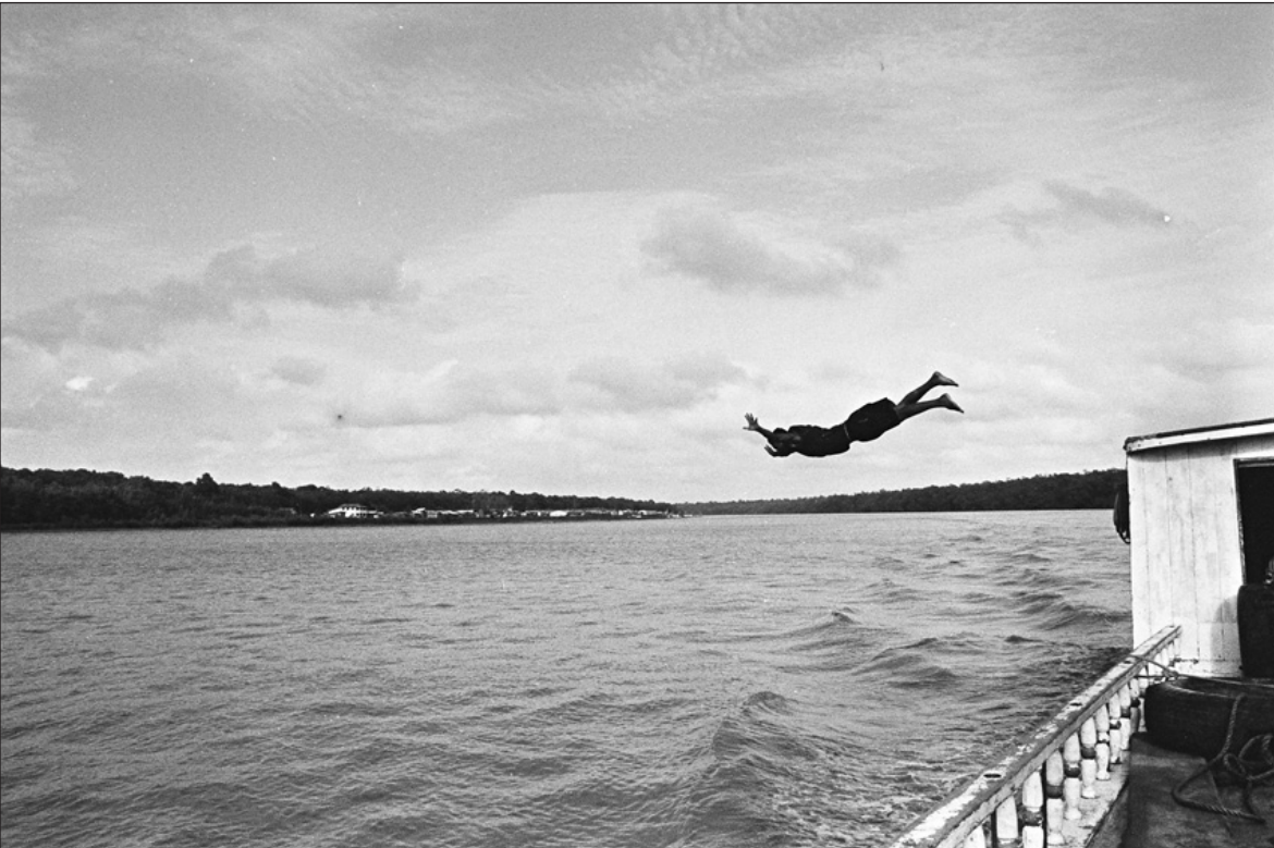
Figura 14 – Quando se aproxima o tempo de embarcar na atividade pesqueira, o jovem passa a freqüentar as saídas dos barcos, permanecendo a bordo até a boca do rio, quando salta para se entregar ao fluxo intenso da maré enchente. Esta manobra destemida o traz de volta da boca do rio até a vila, ao tempo que incrementa seu prestígio frente aos colegas e pescadores. [Douglas]