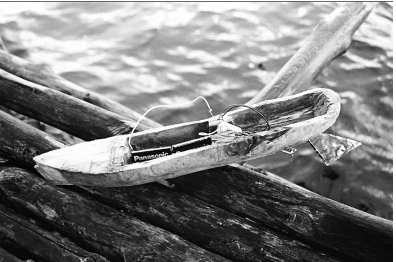
Figura 10 – O barco é elaborado de inúmeras formas na vida dos pescadores costeiros. Esta bricolagem lida preferencialmente com as características diretamente acionadas e valorizadas na pesca, como o torque, a potência e o ruído do motor. [miniatura fabricada por Cocada]