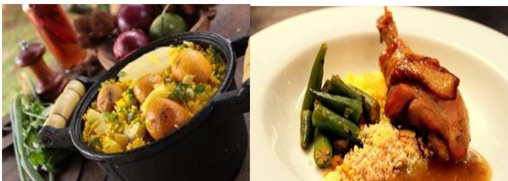
Figura 2 - Imagens da galinhada tradicional e recriada pelo chef Alex Atala

Para melhor visualizar o conceito de releitura de pratos tradicionais a partir das técnicas e conceitos da alta gastronomia, far-se-á uma comparação entre uma receita e foto da galinhada com pequi típica de Goiás e da releitura da mesma galinhada pelas mãos do premiado chef Alex Atala.